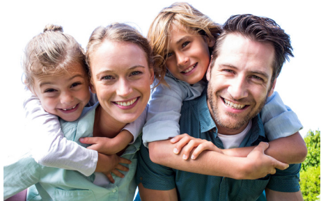
(Agenturfoto. Mit Models gestellt.)

DI-Netz berät Sie gern – im persönlichen Gespräch, per Telefon oder E-Mail – und bietet Vorbereitungsseminare an zur Familiengründung mit Spendersamen .